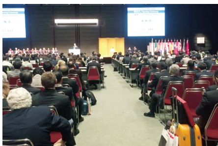
▲開会式典(寛仁親王妃信子殿下)

次回の世界大会は、来年(2017年)9月17日から20日にドイツ・ベルリンで開催されます。