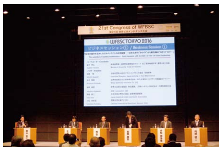
▲ビジネスセッション「日本の強みを活かしたビルメンテナンスの可能性」