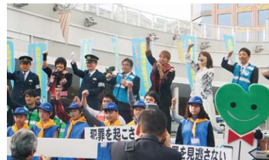
▲愛知県知事を中心に防犯スローガン

キャンペーン後には愛知県警音楽隊の演奏とのフレッシュ・アイリス(女性警察官ユニット隊)によるフラッグ演技にギャラリから大きな拍手がわき起こりました。