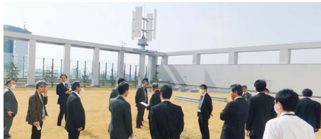
▲駐車棟 屋上緑化、風力発電システム