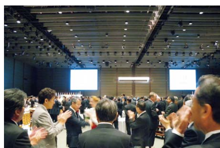
▲歓迎レセプション