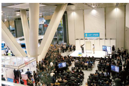
▲ビルクリーニング複数等級化の模範演技会