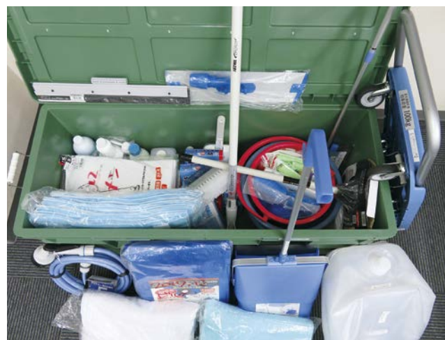
「災害時における避難所の清掃業務の支援に関する協定書」(抜粋) (趣旨)

今後は、平時から、各自治体のほか、地域のボランティア団体とも協働するなど、更に活動の幅を拡げてまいりたいと考えておりますので、引き続き、皆様の御協力をお願い申し上げます。