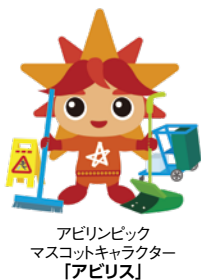
アビリンピック マスコットキャラクター 「アビリス」

第45回全国障害者技能競技大会(アビリンピック)(主催:(独)高齡・障害・求職者雇用支援機構・愛知県)が、2025年10月17日(金)から19日(日)まで、愛知県国際展示場(Aichi Sky Expo・常滑市)で開催され、全25種目の競技に全国から401名の選手が参加しました。